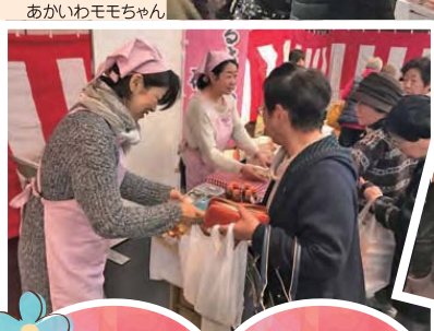
あかいわももちゃん